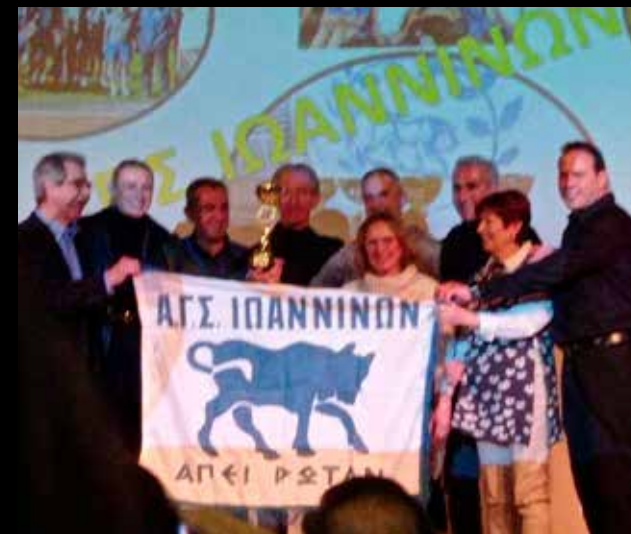
Απονομή στην ομάδα του ΑΓΣ Ιωαννίνων