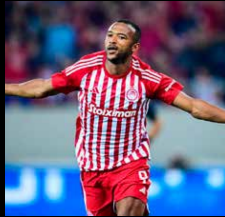
Ο Αγιούμπ Ελ Γκαμπί