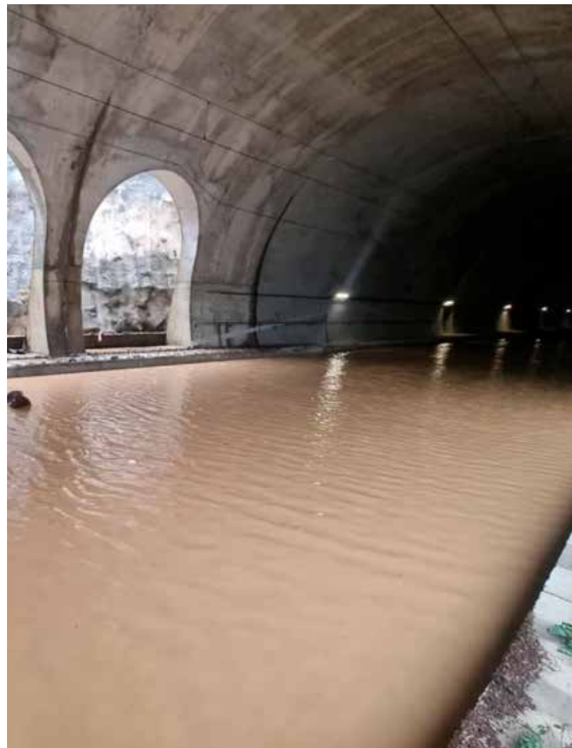
Η πλημμύρα των συρμών στα Τέμπη