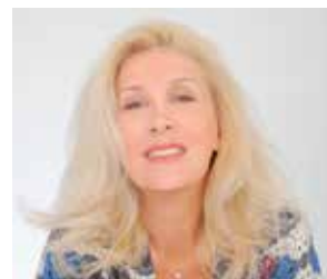
ΑΠΟ ΤΗΝ ΑΛΕΞΑΝΔΡΑ ΚΑΡΤΑ