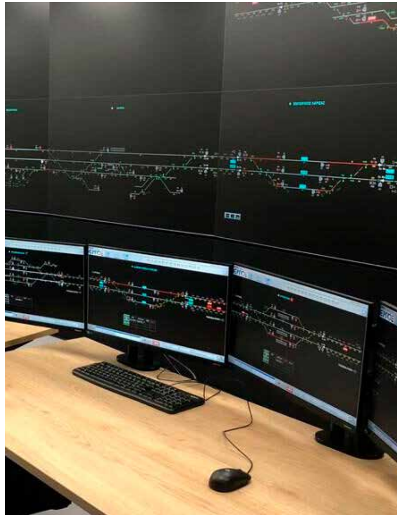
Το σύστημα αυτόματης προστασίας των συρμών ETCS